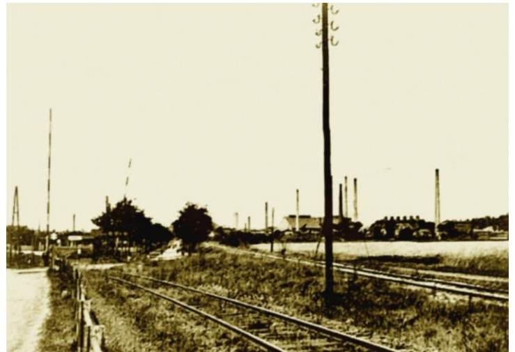
Bahnübergang mit Bahnhof

Im Jahre 1887 wurde die Eisenbahnstrecke Senftenberg - Finsterwalde in Betrieb genommen. Auf einer Länge von ungefähr 4 km befand sie sich auf Hörlitzer Gemarkung. Während sie zunächst hauptsächlich zum Abtransport der geförderten Braunkohle genutzt wurde, kam 1904 auch die Personenbeförderung hinzu. Hart an der Grenze zwischen Hörlitz und Senftenberg II, dort wo sich heute die 1. Einmündung von der Umgehungsstraße aus Richtung Senftenberg nach Hörlitz befindet, war der Bahnhof Senftenberg II, der später in Senftenberg West umbenannt wurde.